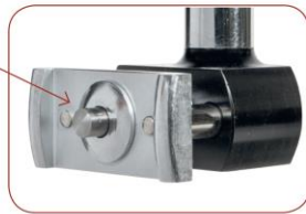
Manual probe release Richiamo manuale puntale